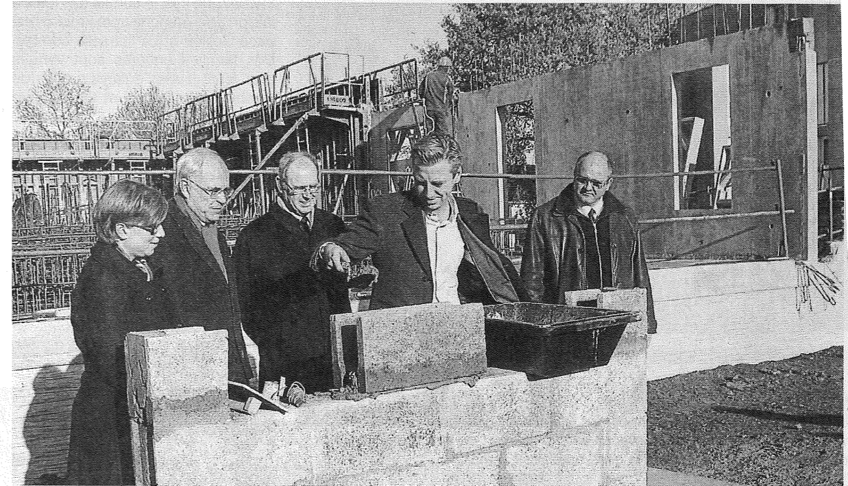
Représentants de la Ville et de LogiOuest ont posé la première pierre du Bois-du-Roy et des Pépinières lundi matin.

Le coût total de ces trois programmes incluant l'ensemble des partenaires financiers s'élève à 17 600 000 €, favorisant ainsi la création d'emplois dans le domaine du bâtiment.