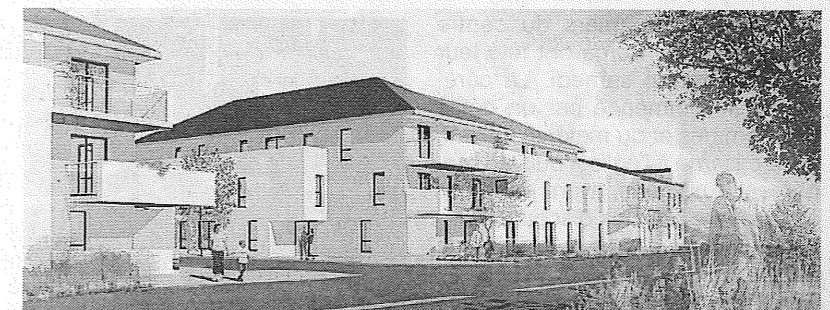
Perspective des locatifs du domaine des Pépinières vus de l'avenue J.-Lurçat.

Par ailleurs, seize maisons individuelles en accession sociale à la propriété seront construites en fond de parcelles avec jardin et garage accolés ou intégrés au logement. Livraison prévue pour le premier semestre 2013.